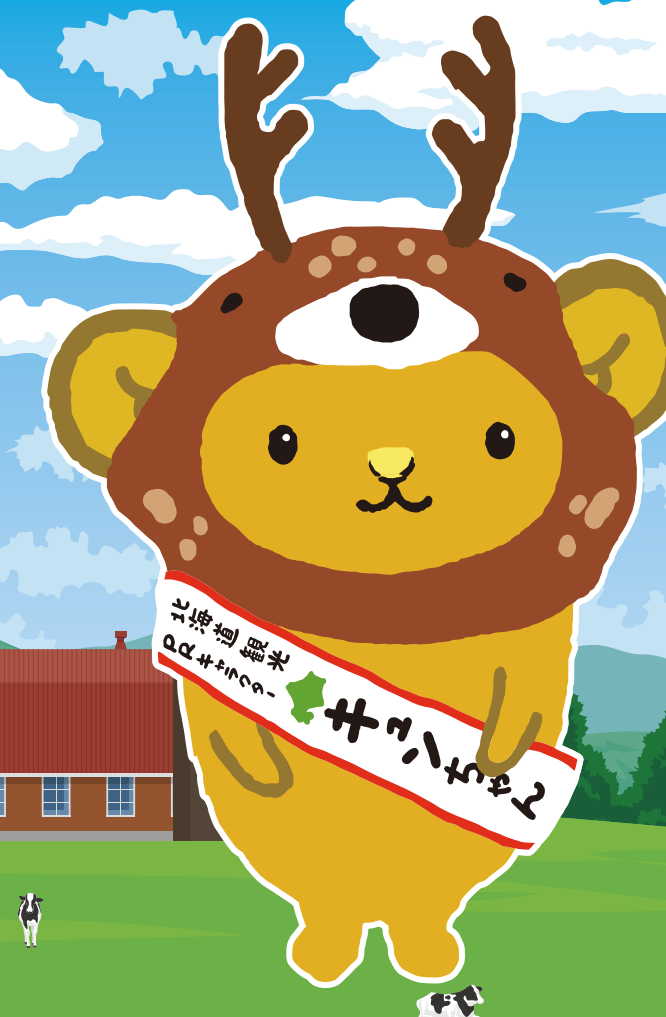
北海道観光PRキャラクター キュンちゃん